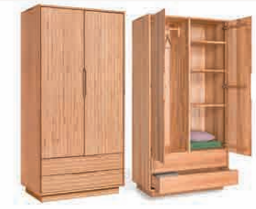
WÄSCHESCHRANK_2 ca. H 195 | B 99 | T 58 cm 2 Türen, 3 Einlegeböden, 1 Kleiderstange und 2 Schubladen ABBILDUNG links Designbuche° geölt, rechts Kernbuche geölt