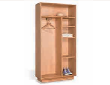
GARDEROBENSCHRANK ca. H 195 | B 99 | T 42,5 cm 3 Einlegeböden, 1 Kleiderstange ABBILDUNG in Designbuche° geölt