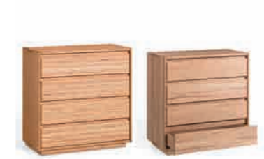
SCHUBLADENKOMMODE ca. H 91 | B 84 | T 42,5 cm ABBILDUNG links in Designbuche° geölt, rechts in Kernbuche geölt