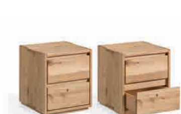
NACHTKONSOLE ca. H 44,5 | B 40 | T 42 cm ABBILDUNG in Wildeiche geölt