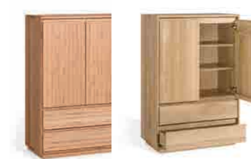
WÄSCHEKOMMODE 2 ca. H 128 | B 84 | T 42,5 cm mit 2 Schubladen ABBILDUNG links in Designbuche° geölt, rechts in Eiche geölt