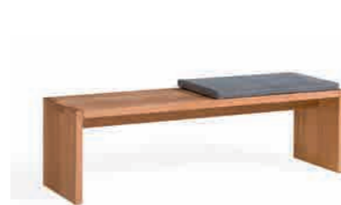
BETTBANK | COUCHTISCH ca. H 40 | B 140 | T 40 cm KISSEN optional ca. 67 x 40 cm ABBILDUNG in Kernbuche geölt