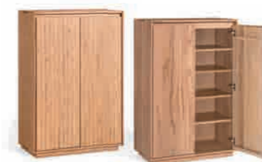
WÄSCHEKOMMODE 1 ca. H 128 | B 84 | T 42,5 cm ABBILDUNG links in Designbuche° geölt, rechts in Kernbuche geölt