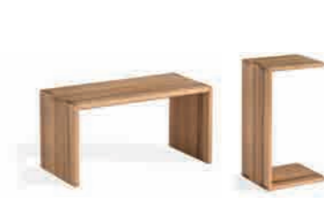
BEISTELLTISCH ca. H 36,5 | B 70 | T 40,5 cm ABBILDUNG in Kernbuche geölt