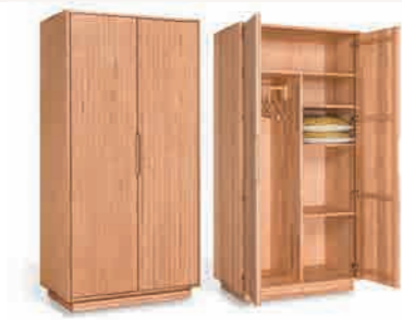
WÄSCHESCHRANK_1 ca. H 195 | B 99 | T 58 cm 2 Türen, 3 Einlegeböden, 1 Kleiderstange ABBILDUNG links Designbuche° geölt, rechts Kernbuche geölt