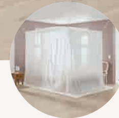
optimale Ergänzung zum Baldachin für besten Rundum-Schutz im Schlaf