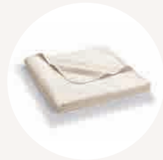
weich, waschbar, robust